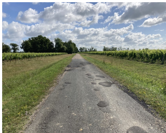
VC N° 101 de Avenue de la Mairie à Bertineau

La commission voirie poursuit son travail de rénovation des routes de la commune.