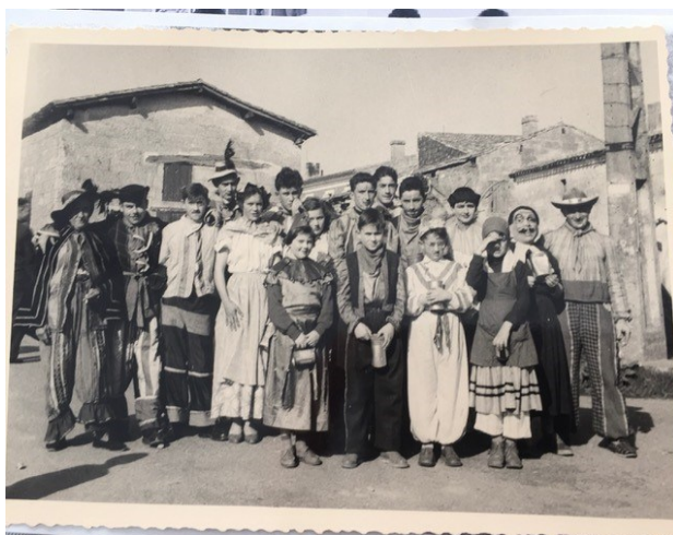
Carnaval à Néac vers 1960, sur la place devant l'épicerie