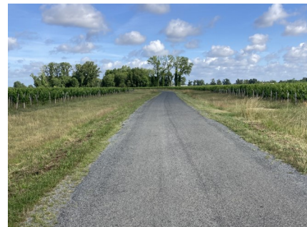
VC N°5 ET VC N° 202 REFECTION DES ROUTES EN 2021 : Rue des Mothes et la route devant la station d'épuration