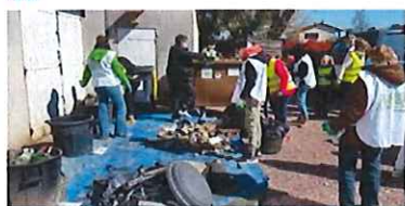
De nombreux bénévoles ont participé au nettoyage manuel des chemins, des fossés et des rues.