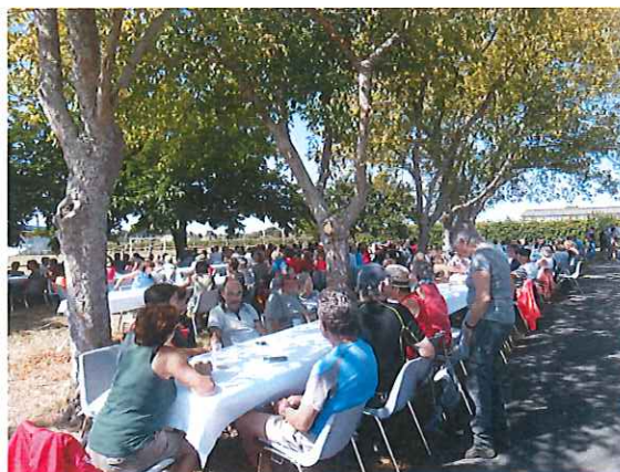
Repas de la marche