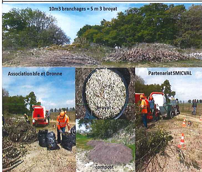
AVRIL Broyage et distribution de compost